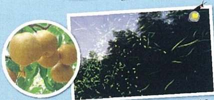
香には白い花、棘にはみずみずしい実をつける。ゲンジボタルは乱舞し、杉林はクリスマスツリーになる

黒川のゲンジボタルは、杉と谷川の地形により、山里独特の乱舞がみられます。6月中旬が最盛期となり、この時期は、大型バスによる見学者も多くいます。