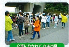
2班に分かれて さあ出発