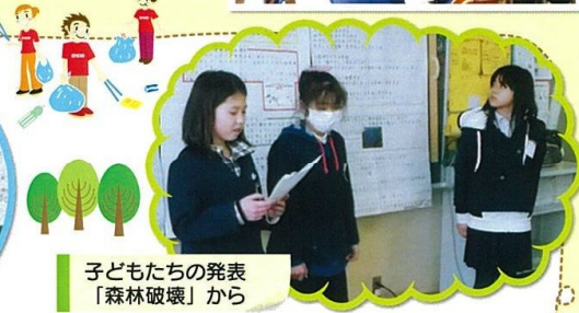
子どもたちの発表 「森林破壊」から

「3R」の1つ、リサイクル(再資源化)はずいぶん浸透してきましたが、ゴミを減らすことをリデュース(Reduce)、そして、繰り返し使うことをリユース(Reuse)といいます。「使った後はリサイクル」はもう常識、これからは「もったいない」を合言葉に、長く使えるものを必要な分だけくり返し使うようにしましょう。