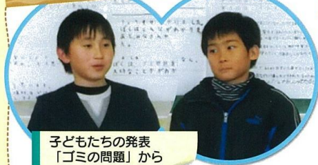
子どもたちの発表 「ゴミの問題」から

家庭から出るゴミの量は年々増え続け、このままだと埋めるところがなくなってしまいます。また、燃やすと地球温暖化の原因の1つ「二酸化炭素」がたくさん出てしまいます。だから、できるだけゴミを減らすことが大切です。買い物には「エコバッグ」を持って行って、レジ袋はもらわないようにしましょう。