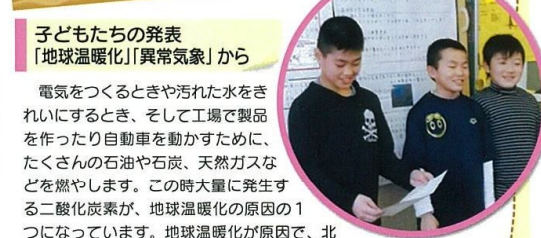
子どもたちの発表 「地球温暖化」「異常気象」から

電気をつくるときや汚れた水をきれいにするとき、そして工場や製薬を作ったり自動車を動かすために、たくさんの石油や石炭、天然ガスなどを燃やします。この時大量に発生する二酸化炭素が、地球温暖化の原因の1つになっています。地球温暖化が原因で、北極の氷がとけ、寒いところに住む動物は絶滅しそうになっています。また、洪水や干ばつなどの異常気象も起きています。だから、二酸化炭素をださないために節電や節水を心がけることが大切です。こまめに電気を消し、使わない電気製品のコンセントははずしましょう。