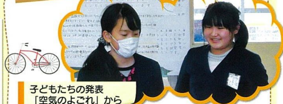
子どもたちの発表 「空気のよごれ」から

工場の煙や自動車の排出ガスは、空気を汚して、酸性雨や光化学スモッグの原因になります。だから、きれいな空気を守るために、自動車の使い方を見直すことが大切です。近くへ行くときは、自動車を使わずに自転車や徒歩で行きましょう。自動車を買い替えるときは、環境にやさしいハイブリット車や電気自動車などのエコカーにしましょう。