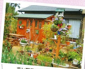
花と野菜であふれるお庭

4月20日(土)・21日(日)、美奈宜の杜地区で「第3回花と野菜のガーデニング・フェスタ」が開催されました。13件の個人宅のお庭や菜園が一般公開されたオープンガーデンでは、見学者がアイデアあふれる庭づくりとその美しさに関心の様子。庭主さんとの会話ははずみ、花と緑を介した交流が深まっていた。同時開催の「ガーデニングセミナー」や「あさくら橋太鼓」などのイベントも盛況で、来場者は、五感をフルに使って「あさくらの春」を満喫していました。