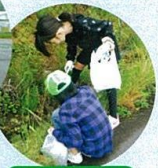
溝の中にゴミ発見

馬田地区では、「ふるさとの環境を自分たちで守ろう」と4年生以上による「馬田少年環境パトロール隊」が結成されています(隊員18名)。隊員の子もたちは、毎月第2土曜日の朝、パトロールする地域の子ども会や保護者と一緒に、20年以上前から校区内の空き缶やゴミを拾って、地域の環境美化に貢献しています。