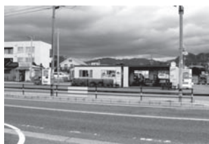
旧西鉄バスセンター周辺整備の願いを込めて

A 今、西鉄の不動産部で検討されているという報告を受けている。現状のままでは平行線だろう。まずは乗り入れ。全体的な開発を市が行うことについては、現在考えていない。