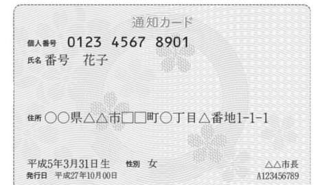
紙でできていて、キャッシュカードサイズです