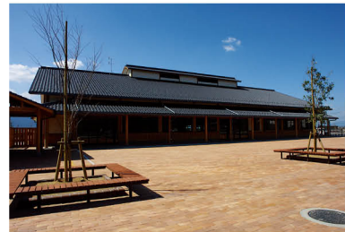
三連水車の里あさくら オープン (2007 年)