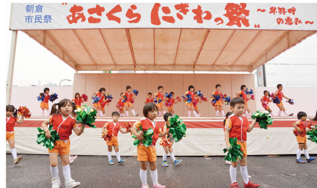
第 10 回朝倉市民祭り あさくらにぎわっ祭 ～卑弥呼の恵み～開催 (2015 年)