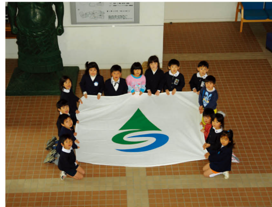
朝倉市誕生 (2006 年)