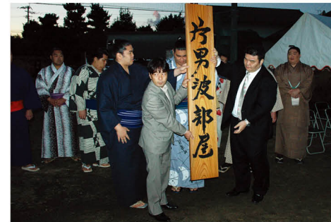
片男波部屋が朝倉農業高校跡地 に部屋を開設 (2011 年)