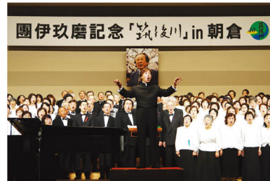
團伊玖磨記念「筑後川」 in 朝倉を開催 (2008 年)