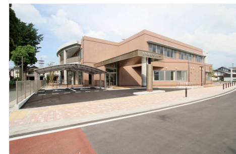
甘木地域センター (フレアス甘木) オープン (2012 年)