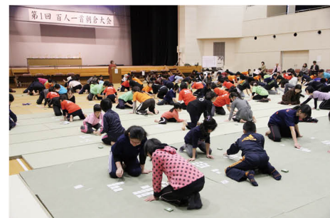
第 1 回百人一首朝倉大会開 催 (2013 年)