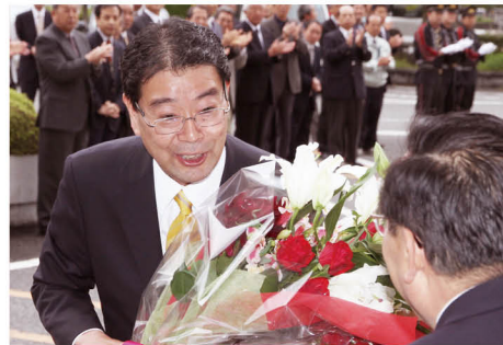
第 2 代朝倉市長森田俊介就 任 (2010 年)