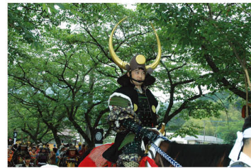
秋月黒田鎧揃え (鎧初) が 60 年ぶりに復活 (2009 年)