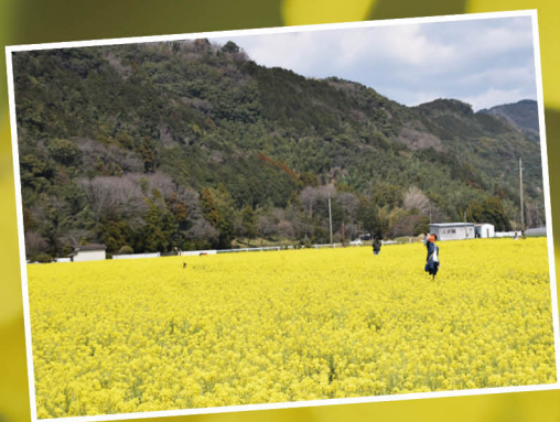
道の駅原鶴ファームステーションバサロ前 菜の花畑 平成 29 年 3 月 26 日撮影