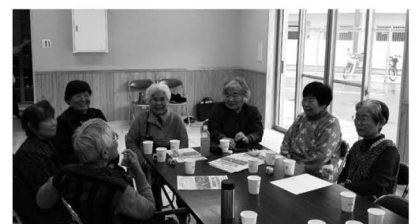
▲住民同士で気軽に会話できるほか、支え合いセンターの職員が相談にも応じます。