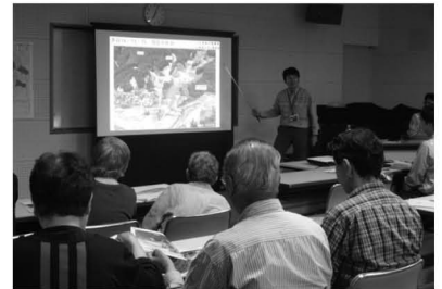
▲詳細設計などについて説明