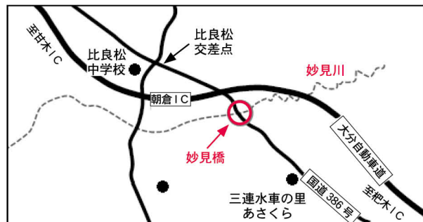
▲妙見川・妙見橋 [国道 386 号 (古毛)]