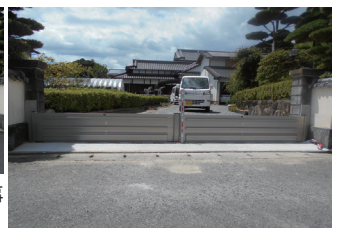
▲▶ 浸水防止板設置工事の例(右が設置後)