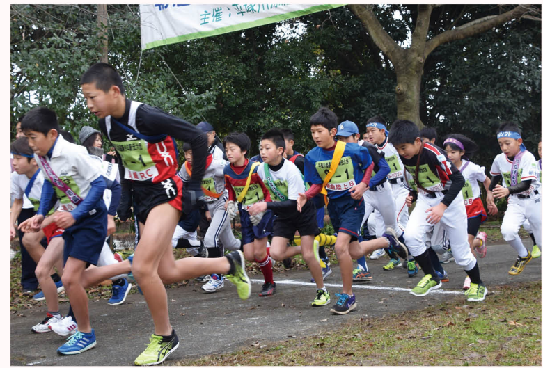
▲寒さに負けず、スタートを切る選手たち。熱のこもった声援が響きました。

1月24日、ピーポット甘木・大ホールで甘木子ども盆唄が行われました。毎年行われていた郷土芸能「甘木盆唄」は豪雨災害で中止となっていました。甘木小学校主催により5年生主体で子ども出演の演目が披露されました。披露されたのは「白浪五人男」と「甘木娘晒舞」。保存会や地域の人々の協力をいただきながら励んだ練習の成果を、見事に披露した子どもたち。観客からは大きな拍手が送られました。