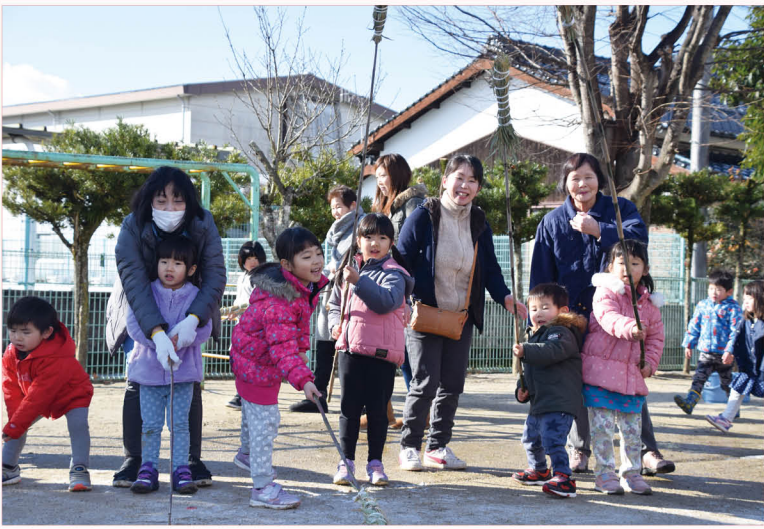
▲伝統行事を通して、子どもたちと大人が笑顔で交流できる機会となりました。

同園の園児たちは、保護者やコミュニティ、地域の人たちと一緒に竹竿を製作。「もへらうちは14日、だんだらぐゆは15日、のきだれつきだれつちまわせ」と威勢のよいかけ声とともに元気よく地面をたたきました。