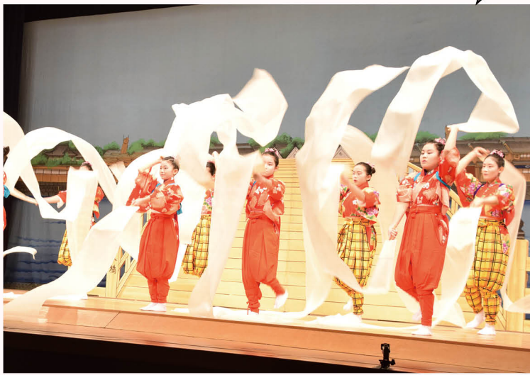
▲「甘木娘晒舞」では、自分の背丈の倍ほどある晒が華麗に操られ、その姿に観客たちは魅了されました。