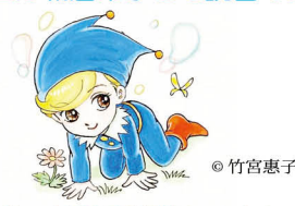
朝倉市子どもの読書活動推進キャラクター