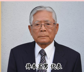
黄金川を守る会 （屋永）

清流黄金川は、スイゼンジリノ保全をはじめ、防火用水、田畑を潤す役割を担う地元の宝です。この清流黄金川を守るために、金川校区の住民と多くのボランティアのご協力をいただき、約5年前から清掃活動などの保全活動を始めました。このような素晴らしい章をいただき、感謝するとともに、引き続き、頑張らないといけないという気持ちを新たにいたしました。