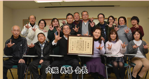
朝倉市手話の会 愛音の会 （甘木）

私たちは昭和51年から活動をしています。今回の表彰は、手話通訳や要約筆記活動、聴覚障害者の福祉に関する研修など幅広く活動していることを評価いただいたものとして嬉しく思います。特に、最近は防災学習に力を入れており、7月の豪雨災害ではそのときの学びが活かされた事例もありました。今後も、この表彰に満足することなく頑張りたいです。