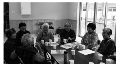
▲住民同士で気軽に会話できるほか、支え合いセンターの職員が相談にも応じます。