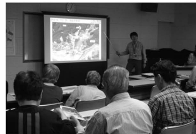
▲詳細設計などについて説明