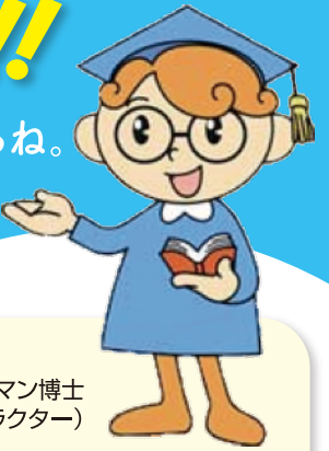
ヒューマン博士 (福岡県の人権啓発キャラクター)

県が、部落差別の解消を推進するために条例を改正しているね。ヒューマン博士に条例のことを教えてもらいましょう。