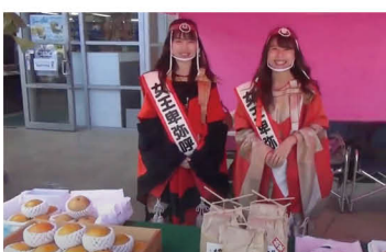
▲令和2年10月18日、BAYSIDE HAWAIIAN HULA での出演

一年後にはきつと朝倉のことをもっと好きになつていきたいと思います！自身も学び、楽しみながら情報発信頑張ってください！