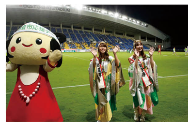
▲令和2年9月13日、アビスパ福岡朝倉市応援デー