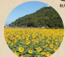
杷木大ひまわり園