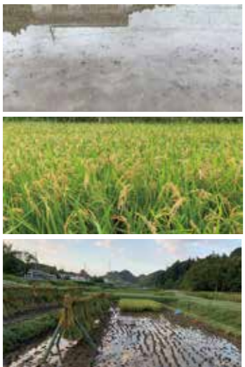
▲昨年からお手伝いしていた高木地区の田んぼ。田植えから稲刈りまで。

朝倉への移住・定住を検討している人には、お試し居住がおすすめ。詳しくは市HPへ。