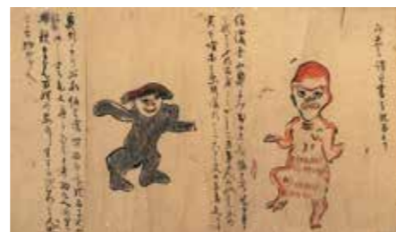
▲朝倉市指定文化財「三奈木品照寺文書」『諸国化物図巻』(法喜山品照寺蔵)より抜粋