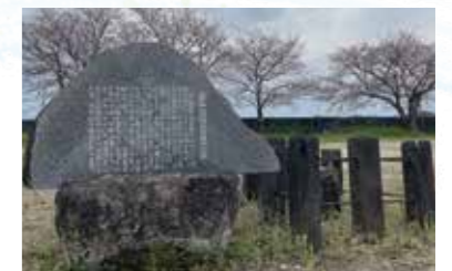
▲桑原地区の古井戸の跡

今回から三奈木・金川地域を紹介します。佐田川に架けられた小田橋を東に向かうと桑原神社や湧水池が見えてきます。神社を南に向かうと台地の先端に五所権現(ごしょごんげん)があり、五所権現の境内に古井戸の跡があります。昔、この近くに住む老婆が大きな雷の音を聞き慌てて見に来たところ、この井戸に雷神の子どもの落ちていました。これ以上雷神の子どもの悪さをしないよう、井戸に蓋をかぶせ、漬物石を置きました。雷神の子どもの泣き叫び、出してくれと懇願しますが、雷の被害が恐ろしい老婆は逃がすことはありませんでした。そこで雷神の子どもの「いいことを教えるので出してください。雷が鳴った時はくわばら、くわばらと唱えると、そこには決してかみなりを落とさせません」と話しました。以降、桑原の住人は雷雲が近づくと「くわばら、くわばら」と唱えるようになり、雷神の子どもの言葉どおり落雷の被害は無くなったとの事です。