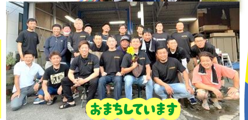
おまちしています

立石在住・立石で勤務されている45歳までの青年の方「立石青年団」で一緒に活動しませんか? 地域貢献をして仲間と一緒に立石を盛り上げましょう!!