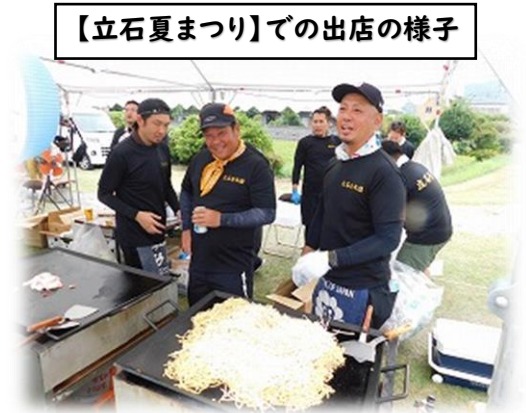
【立石夏まつり】での出店の様子