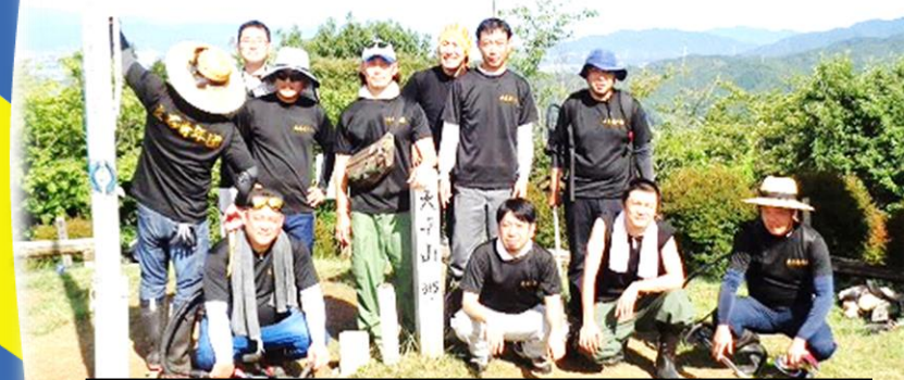
【大平山草刈り作業】は、夏と秋の年間2回の参加協力中