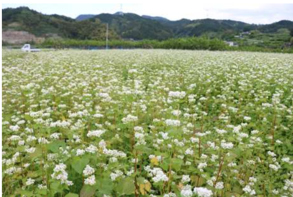
ソバの花（松末地区）