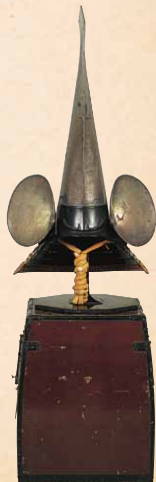
律管脇立桃形兜・ 緋糸威胴丸具足 小具足付