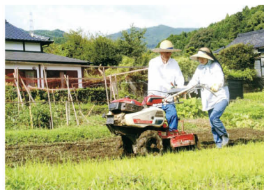
平成27年度「家庭部門」最優秀作品 「出来ますよ、私にも」

応募作品について 応募作品の使用権、著作権は朝倉市に帰属するものとし、返却しません。作品は講演会等で展示するほか、市ホームページに掲載するなど男女共同参画に関する啓発資料として活用します。