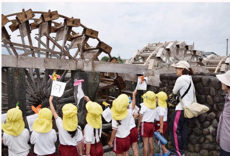
▲水車が回り始めると、子どもたちから歓声が上がりました。

朝倉市の国指定史跡「三連水車」が6月17日、勢いよく水しぶきをあげ稼働しました。水神社（恵蘇宿）で「山田堰通水式」が行われ、山田堰の水門が開くと、堀川の水位がだんだん高くなり、水車はゆっくりと回り始めます。見学に来ていた子どもたちが「がんばれ！がんばれ！」と声援を送ると、水車は徐々に勢いを増し、水を汲み上げ田を潤し始めました。水車は稲作期間の10月中旬まで稼働します。