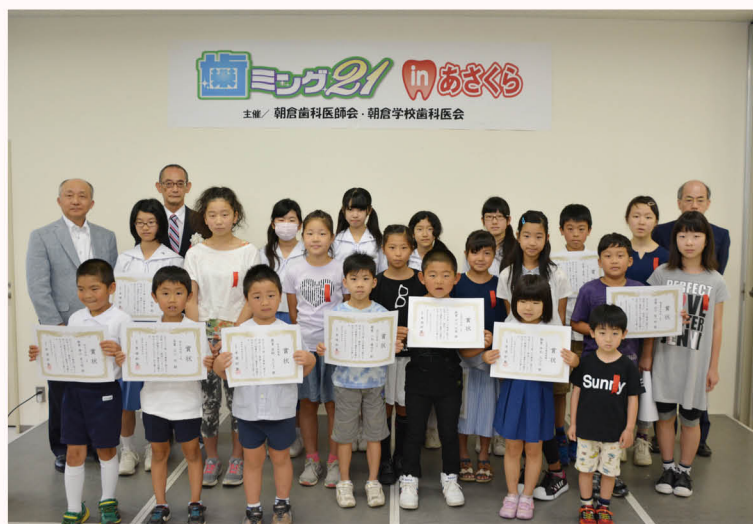
▲「歯・口の健康に関する 図画・ポスター・標語」コンクール表彰者たち

80歳以上で20本以上の自分の歯を持つ人を表彰する「ハチマルニイマル 高齢者よい歯」の表彰のほか、児童生徒を対象とした「歯・口の健康に関する図画・ポスター・標語」コンクール表彰、「歯にいいレシピ」紹介などが行われ、参加者は健康な歯を維持することの大切さを学びました。