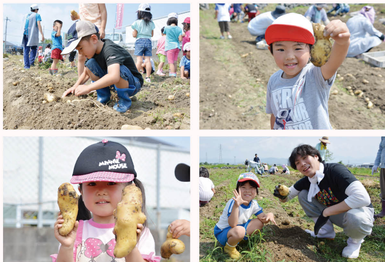
▲みんなでたくさんの大きなジャガイモを収穫しました。