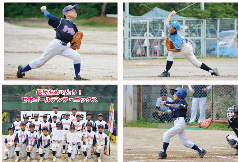
▲選手みんなが全力をだしきり、大会を盛り上げました。

選手たちは夏の日差しが照り付けるなか、白球を一生懸命追いかけ、「投げる」「打つ」「走る」全てのプレーを楽しんでいました。