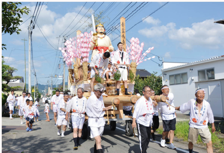
▲例年、山は博多祇園山笠で使われたものを使用していたが、今年自主制作されました。