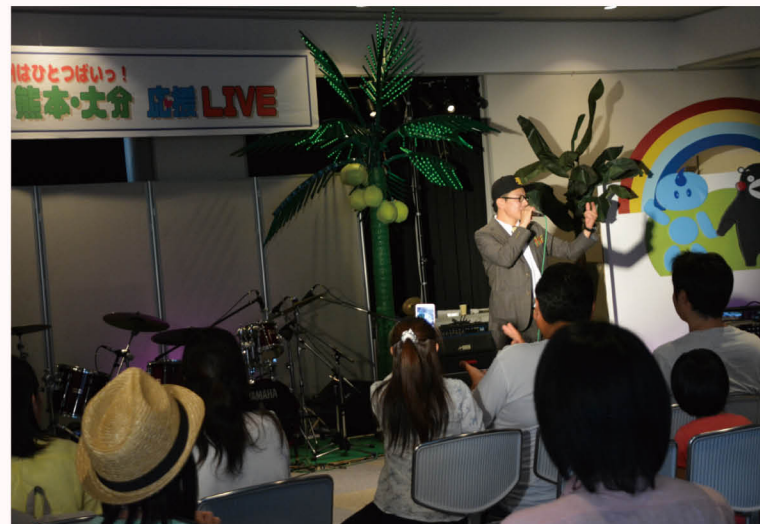
▲716 (ナナイロ) の演奏で盛り上がりを見せる会場の様子