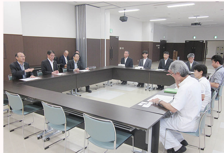
▲応募機会の拡大と早期の求人提出を要請しました。

高校生の地元での就職希望が増加しているなか、朝倉医師会病院、朝倉商工会議所を訪問し、応募機会の拡大と早期の求人提出を要請しました。