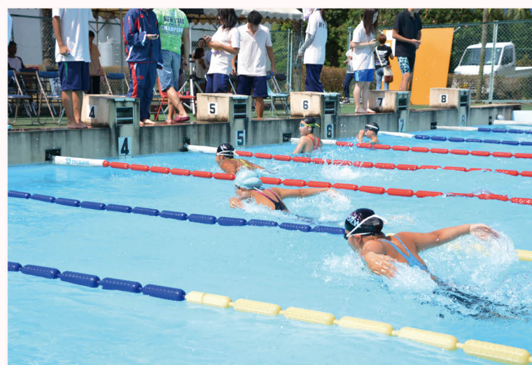
▲最後まで水をかき、自己記録の更新に挑みました。

7月18日、ブリチストン甘木工場50メートルで、朝倉市郡水泳競技会が開催されました。朝倉市郡の小学生から大人までの191人の選手が自己記録の更新を目指して、それぞれの種目で競い合いました。 この大会は、福岡県民体育大会夏季大会の予選を兼ねています。選手たちは大会出場を目標に厳しい暑さのなか、日ごろの練習の成果を発揮し、力強く水しぶきをあげ、ゴールを目指して泳ぎ抜きました。