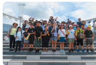
53名の参加者でスマイル！

学校外活動は、目的地を変えて毎年実施しています。4・5・6年生の縦割り班で、6年生がリーダーとなり、下学年を引っ張ってくれます。今年度も班活動では、時間やマナー