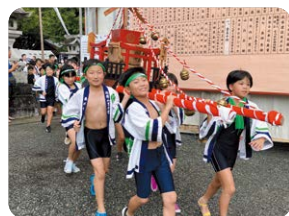
元気に須賀神社に入り「わっしょい!!!」「わっしょい!!!」出発!!