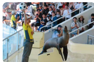
アシカショーの様子