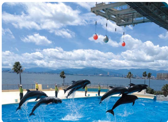
イルカショーの様子

を守り協力して楽しく活動することができました。「イルカ・アシカショー」ではダイナミックな演技や水しぶきに大きな歓声が上がりました。館内でも、海の生き物の生態に触れ、目を輝かせて見学する姿がありました。今後もこの活動を継続し学校外での豊かな体験の場を広げていきたいと考えています。