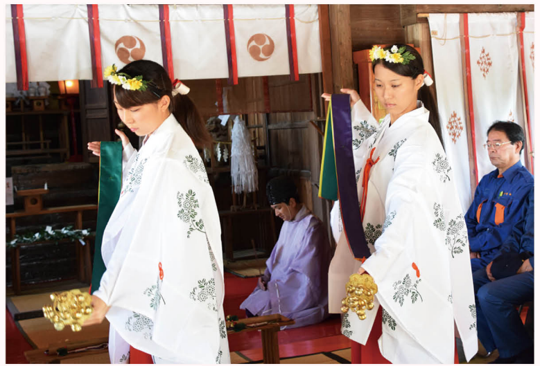
▲復興への願いをこめて、浦安の舞を舞う巫女