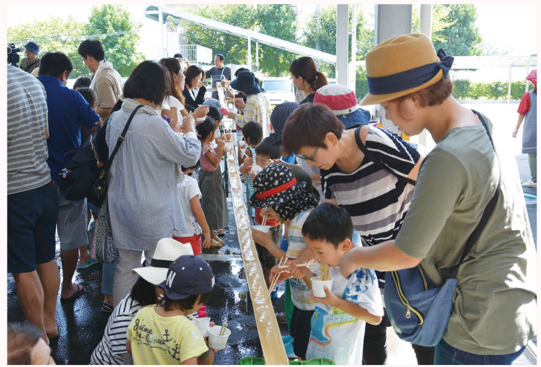
▲そうめん流しでは、たくさんの家族連れが長蛇の列をつくり、一生懸命にすくったそうめんを美味しく食べました。

8月20日、子どもたちを元気づけようと「夏まつり」が催されました。そうめん流しやヨーヨー祭り、すいか割りなど子どもに大人気のイベントが自由押しで、会場は大いに賑わい、子どもたちから笑顔が溢れていました。