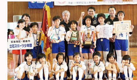
▲チームスローガンの「笑顔」が試合中もたくさん見られ、息の合ったプレーで優勝を勝ち取りました。