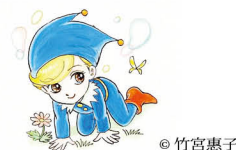
朝倉市子どもの読書活動推進キャラクター