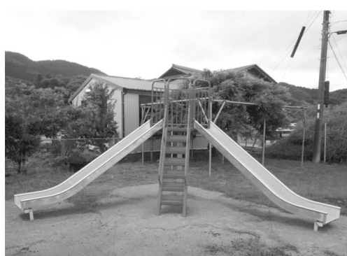
▲持丸区民広場に整備された滑り台