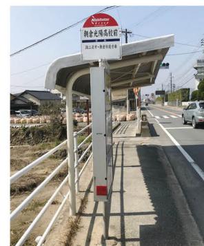
▲ 久喜宮コミュニティが補助金を活用して修復したバス待合所

市では平成 28 年度から、バスの待合環境などの整備に取り組む交通事業者や住民自治組織などに対してバス停待合所や駐輪場の整備などに要した費用の一部を補助しています。