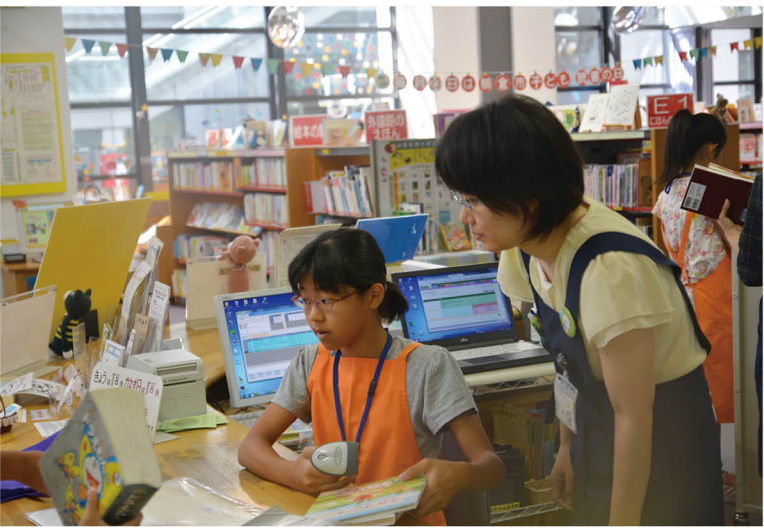
▲ スタッフに見守られながら、緊張した様子でカウンター業務を行う参加者

8月10日、夏休み中の小学生を対象に本や図書館に親しんでもらうことを目的に、市内図書館で1日図書館員体験が行われました。 子どもたちは、本の貸出や返却などのカウンター業務や、おはなし会などを体験。 参加者の一人は「図書館を利用する人のために、見えないところでも働いていて大変だと感じました。でも、とても楽しかったです」と笑顔で話しました。