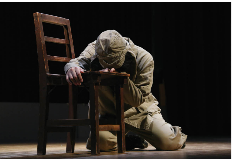
▲ 劇「ニューギニアの星」の一場面。戦場のニューギニアで家族を思いながら戦死して行く兵隊の姿が表現されました。

8月5日、ピーポート甘木で朝倉市民平和祭が開催されました。 第13回となる今年は、劇「ニューギニアの星」を上演。実際に市にあった甘木高射砲部隊に所属していた将兵とその家族の実話をもとに作られた劇で、演じたのは実行委員を始めとする市民の皆さん。来場者の多くが目に涙を浮かべながら、改めて平和の尊さを実感するひとときとなりました。