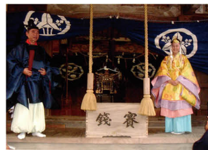
▲平成28年度「地域部門」最優秀作品「お祭り」

応募作品の使用権、著作権は市に帰属するものとし、返却しません。作品は講演会等で展示するほか、市ホームページに掲載するなど男女共同参画に関する啓発資料として活用します。