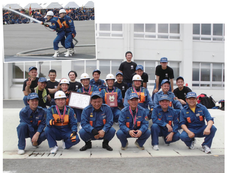
▲ 5位入賞を果たし、満足そうな表情の団員たち

7月22日、福岡県消防操法大会が開催され、6月に行われた市大会で優勝した第17分団が「小型ポンプの部」に出場しました。 限られた時間の中、約3カ月にわたる訓練を続けた団員たち。市の代表として堂々とした操法を披露し、5位入賞を果たしました。 大会を終えた選手たちは「期間中、地域・職場・家庭など多くの人に協力と応援をいただいたことに感謝したい」と語りました。