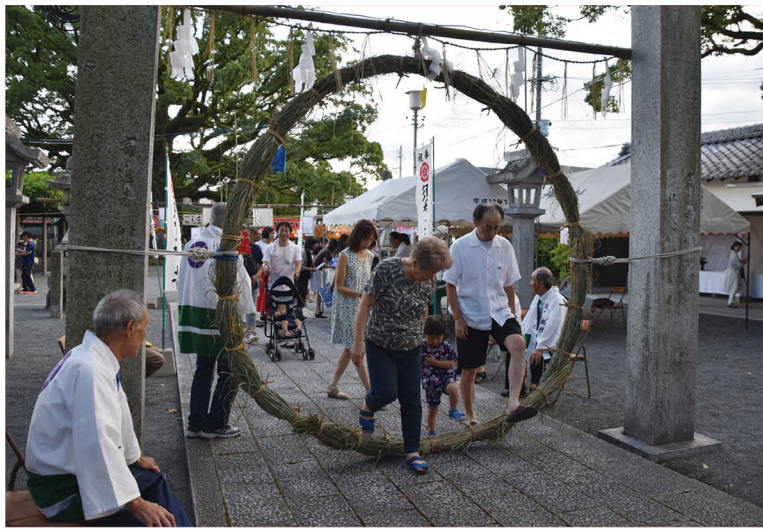
▲ 子どもの手を引きながら「茅の輪」をくぐる参拝者たち

7月31日、須賀神社（甘木）で夏越祭りが開催されました。 毎年7月31日に行われる祭りで、茅を編んで作った直径2メートルほどの輪をくぐって、御祓いしてもらい、無病息災を願います。 会場では、地元小学生の俳句が飾られ、出店も並び、多くの人々が賑わいました。「毎年楽しみにしている」という家族連れは「子どもが元気に育ってほしい」と笑顔で話しました。