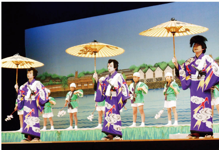
▲ 今年は平成29年7月九州北部豪雨復興記念公演として上演。「白波五人男」は、華やかな下座音楽で始まり、児童たちが言葉の技巧を駆使した長いせりふ「ツラネ」を堂々と披露しました。