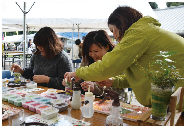
▲ 多様な催しのひとつ、カラフルな砂と観葉植物を組み合わせて楽しむサンドアートづくりに挑戦する参加者たち

会場には、美味しい果物や新鮮野菜、花苗などが売られたほか、サークル活動などが盛んな美奈宜の杜住民による文化作品の展示や体験教室、ステージイベントなどが行われました。秋の魅力があふれた会場は、たくさんの親子連れなどで賑わいました。