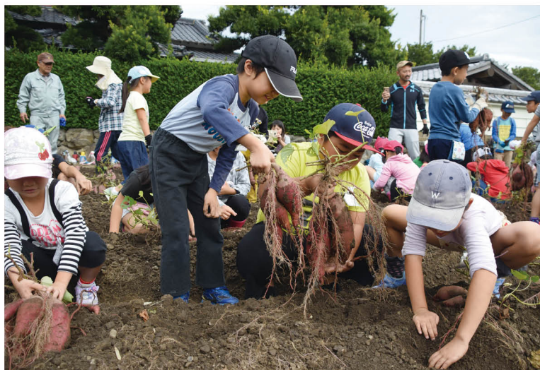
▲ 大きなサツマ芋を一生懸命掘り出す子どもたち。子どもたちや親子での貴重な食育体験となったようです。

5月に子どもたちが苗を植えた畑には、大きな芋がたくさん。子どもたちは泥だらけになりながら芋掘りを楽しみ、大きな芋を掘り出すと、大歓声。最後には、畑の世話をしてくれた青年たちに感謝の言葉を伝えました。