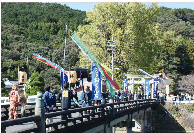
▲ 総勢約200人の御神幸行列が威勢よく声を上げながら寺内橋を渡りました。

奉納される「御神幸行列」は、朝倉市指定無形文化財。参勤交代を模したもので、江戸時代から続く歴史があるといわれています。おくだりが行われた28日、獅子舞や浦安の舞が披露された後、行列が参道を下りました。行列がゆつくりと優雅に橋を渡る姿は秋空によく映えて、見物客を魅了しました。