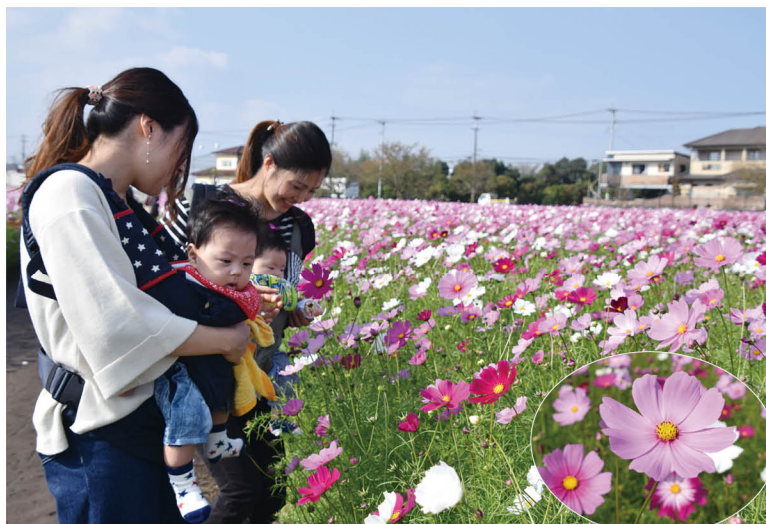
▲ 秋の観光スポットとして親しまれるキリン花園。一面に広がる1千万本のコスモスを一目見ようと、親子連れの見物客も多く訪れました。

期間中は物産展のほか、市内のコスモス料理協力店舗をまわる「コスモス食べて！スタンプラリー」も実施。市内外から約21万人の人々が訪れ、秋の風物詩を楽しみました。