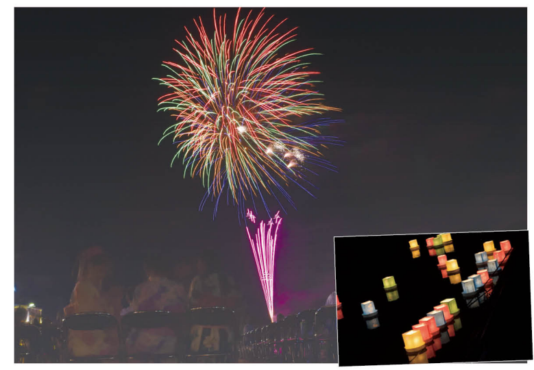
▲会場には「毎年の楽しみ」として浴衣などで訪れている人もたくさん。流灌頂で浮かべられた灯籠は、温かに光り、戦没者などの御霊を慰めました。

甘木川花火大会・流灌頂法要会 8月24日、小石原川甘木橋下流で復興を祈願した甘木川花火大会と戦没者などを悼む流灌頂法要会が行われました。 当日は、雨の中始まりましたが、徐々に晴れ、見事に4千発打ち上がった花火。訪れた多くの人々を魅了しました。 この後に行われた流灌頂では、第2次世界大戦などでの戦没者や平成29年の豪雨での犠牲者を供養。ろうそくの火を点した灯籠が川に浮かべられました。