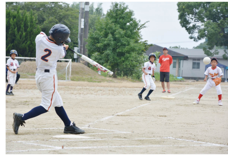
▲福田ソフトクラブ対ウインズ弓削(久留米市)の試合。ランニングホームランや内野手・投手のファインプレーも飛び出し、両チームに大きな歓声が送られました。

甘木・朝倉チビツ子ソフトボール大会 8月18日、甘木・朝倉チビツ子ソフトボール大会第42回大会が、福田小学校、立石小学校で開催されました。 朝倉市からは6チームが出場。周辺市町の6チームと優勝を競い、熱戦を繰り広げ、朝倉チャイルズが準優勝しました。 選手たちは、チームメイトや保護者の声援に応えるように、必死にボールを追いかけて、はつらつとプレーしていました。