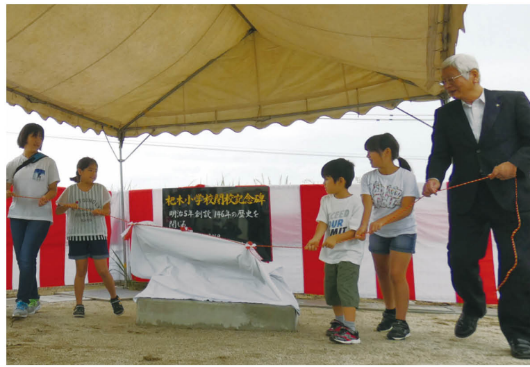
▲除幕式には約80人が参加。当時の在校生約20人も集まり、記念碑の除幕を行いました。埋められたタイムカプセルは11年後に開封されます。

旧杷木小学校閉校「記念碑」除幕式 8月25日、旧杷木小学校で杷木小学校閉校「記念碑」の除幕式が行われました。 旧杷木小学校は、杷木地域の4小学校の統合に伴い、平成30年3月に146年の歴史に幕を閉じました。 記念碑の除幕後には、当時の在校生が書いた未来へのメッセージを、タイムカプセルに入れて埋めました。 旧杷木小学校の歴史は、記念碑に刻まれ、これからも後世に残されます。