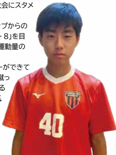
▲九州大会にはDF(右サイドバック)として先発出場

両親の支えや周りのサポートがあるからサッカーができています。サッカーはボールを蹴ったら蹴っただけ自分の身に付いて、自分自身が成長できるスポーツです。サッカーができることへの感謝の気持ちを忘れずに、絶対に結果で恩返ししたいです。