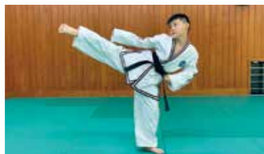
▲「後ろ横蹴り」は頭の高さまで足が上がります

普段の練習は、甘木中学校の武道館で毎週金曜日の19時から行っています。本来なら思いっきりテコンドーをやりたいところですが、コロナ禍で思うように練習ができないのが現状です。それでも野外での練習を行うなど、テコンドー一達のために工夫をしながら頑張っています。テコンドーをやりたいと思う人は、一緒に練習しませんか？