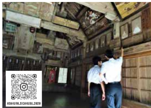
▲馬見神社(嘉麻市)で調査をする部員たち。部の公式Instagramもチェックしてみてください。