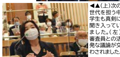
◀(上)次の世代を担う中学生も真剣に聞き入っていました。(左)審査員との活発な議論が交わされました。

第10回目を迎えた今年度は、「若者が活躍できる住みよいまちをつくるために」がテーマ。令和3年10月24日に朝倉市役所議場で開いた発表会では、一次審査を通過した7組が、林市長や8人の審査員、観覧者、中学生が見守る中、いきいきと力強く発表しました。どのグループも市の課題を明確に捉え、情報を集めて分析し、発表方法やデータも工夫されており、とてもレベルの高い発表会でした。