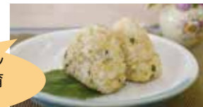
小中学生部門・最優秀賞の「カルシウムたっぷりおにぎり」。市内保育所(園)でも提供されました。