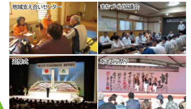
地域支え合いセンター