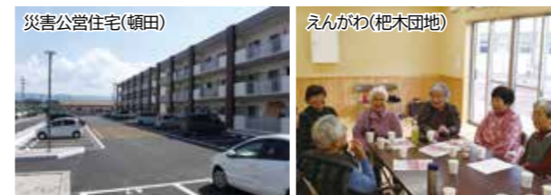
災害公営住宅(頓田)