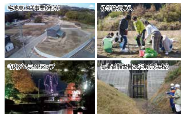
宅地高上げ事業(寒水)