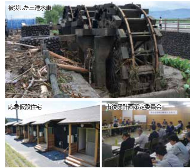
被災した三連水車