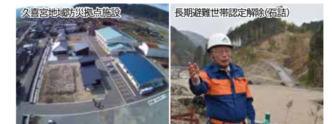
久喜宮地域防災拠点施設