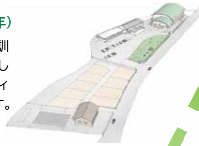
志波防災拠点施設・防災広場イメージ図