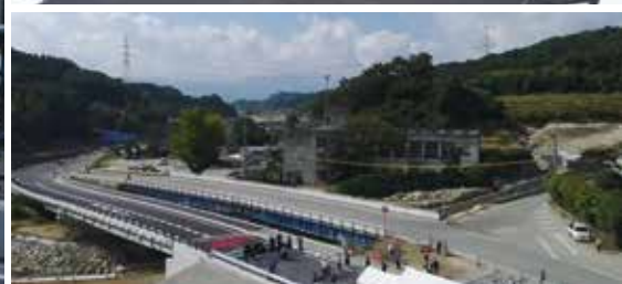
📷 10月23日、県道八女香春線松末橋開通式・渡り初め(関連 26 ページ)