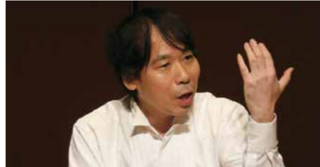
「涙と笑いのあつという間の時間」と全国で評判になる。多様な視点から人権問題や教育問題にメッセージを送る語り部。

※講演会の前に、第17回人権作品コンクールの表彰式、 優秀文章の発表などを行います。