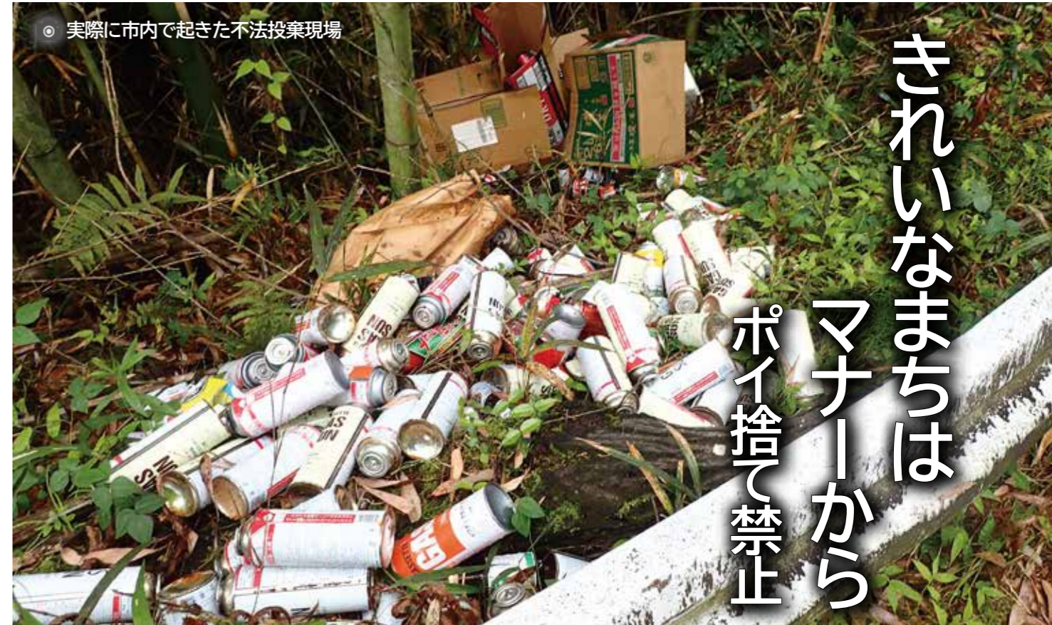
実際に市内で起きた不法投棄現場