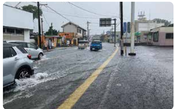
令和3年9月の大雨で浸水した県道福岡日田線

A 共通システムを活用し、想定される浸水の要因等をデータ化して、関係各課で情報を共有している。浸水の要因は多岐にわたるため、各課の業務の中で短期的あるいは長期的な浸水対策の検討資料として活用している。