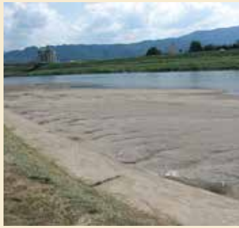
筑後川右岸に堆積した土砂

今回の活動は、川の駅原鶴パークゴルフ場が豪雨のたびに何度も被災したため規模を縮小し、9月定例会において使用料を改定する条例案が上程されたことを受け、原鶴温泉で現地調査を行ったものです。