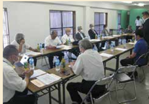
各種取組の説明を受けました

現地では、パークゴルフ場の3つのコースのうち2コースが使用できない状況であることや、5月の鶴飼再開以降も筑後川に土砂が堆積し続け、水位低下のため中断せざるを得なかったとの説明を受