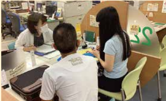
転入される方の不安をやわらげます