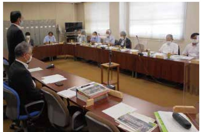
長崎県大村市議会 防災・減災に備えた インフラ等調査特別委員会 行政視察