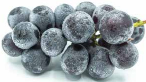
朝倉の気候に合った特産品づくりを

A 課題と捉えている。今後、県の機関、試験場等と連絡を密にし、どういった農作物が適しているかを含め、検討・協議していく。