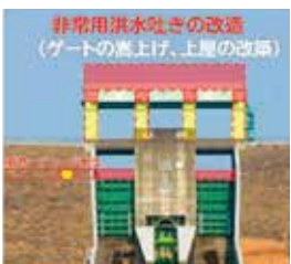
寺内ダム非常用洪水吐改造イメージ

A 事業の推進や度重なる災害により新しい課題も発生しているが、市の水政策上の課題であると認識し、関係機関と取り組んでいく。