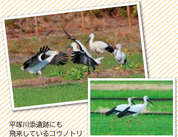
平塚川添遺跡にも飛来しているコウノトリ