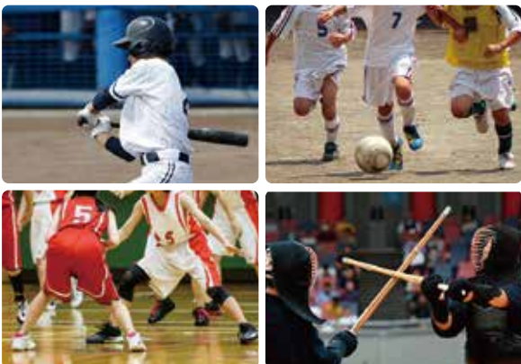
将来の朝倉市を担うリーダーに

A 子どもに楽しさ、悔しさ、厳しさを経験させ、心身の成長を支える重要な活動である。様々な方の意見を伺いながら考えていく。