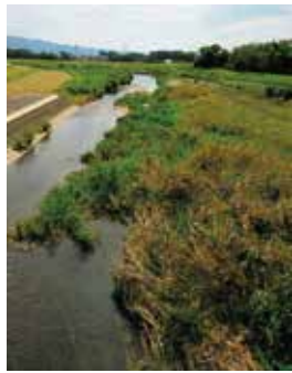
土砂で狭くなった佐田川目に見える工事が必要

A 筑後川河川事務所には地元への丁寧な説明を求めていく。河川整備計画とは別に二次掘削で対応する予定である。