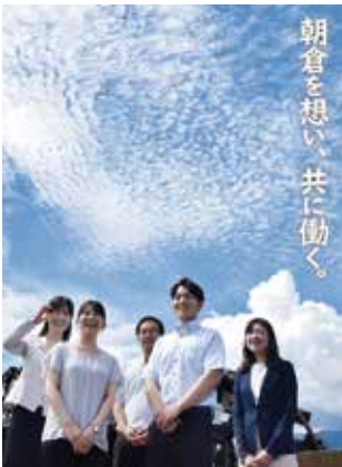
朝倉市の未来を創る

A 質の高い行政運営のために人材育成は極めて重要であり、職員は自らの資質を磨くことが求められる。また、職場の雰囲気、風通しが良くなることも大事である。研修やOJT等を活用しながら、人材育成に努めていく。