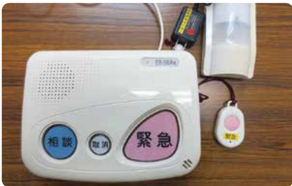
緊急通報装置 設置希望は地域包括支援センターへ(要件あり)

A 地域包括支援センターや民生委員から、事業の対象となる世帯の情報を得ているが、さらに広報等で周知を図る。