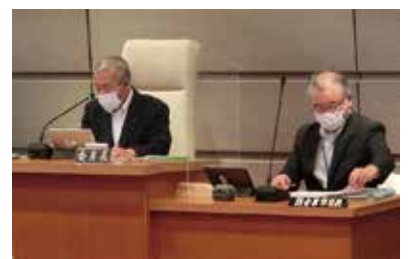
4日間かけて審査を行いました