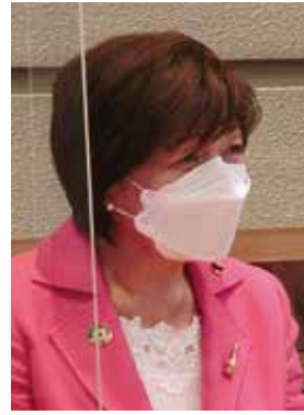
おおば きみ子 議員