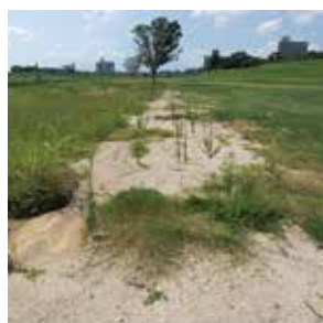
荒廃したパークゴルフ場