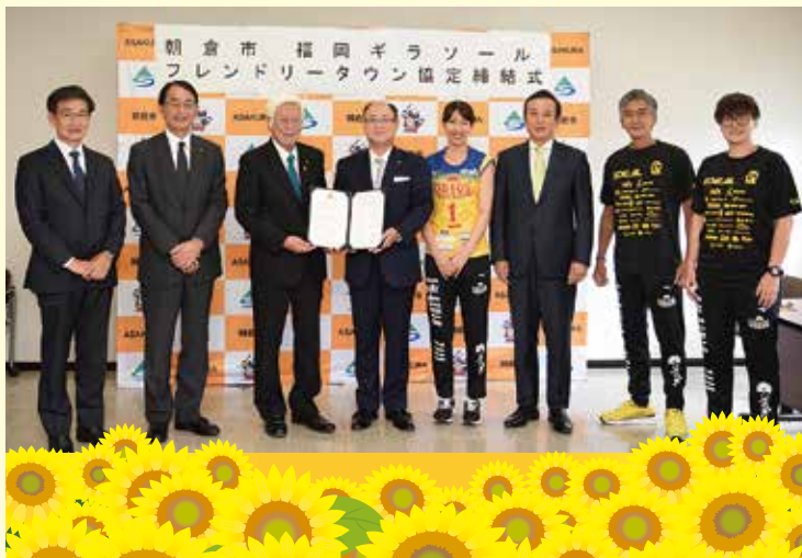
これからのチームの活躍に期待しています

※ 9月補正予算の一部を抜粋しています。 ※ この他に、介護保険特別会計、水道事業会計の補正を行いました。