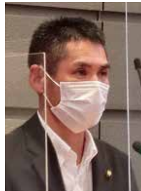
仲山 ゆたか 議員