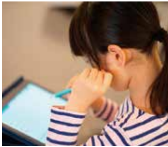
タブレットを積極的に活用

A 学校では様々な場面で積極的にタブレットを活用した授業を進めている。また、家庭でのタブレット持ち帰り学習も行っている。通信環境が整っていない家庭には、ルーターの貸し出しも行っている。