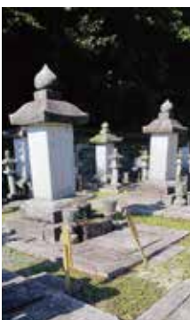
古心寺 黒田家墓所

A 市内の36か所が確認されており、山城は民地が多い。積極的に埋蔵文化財包蔵地として登録していく。