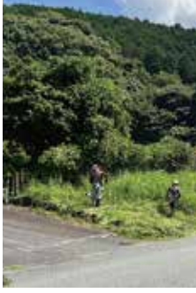
環境センターへの道草を刈り綺麗になりました

A 轍は住民からの情報提供もあり、補修工事を10月末までに完了する。中央線の引き直し、路肩部の土砂撤去は今年度中の対策を検討している。