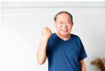
なによりも健康が一番

A 国保データベース（KDB）システムでの速報値では、入院では精神・ガン・循環器、外来では糖尿や高脂質・ガン・循環器に関する医療費が上位を占めている。これらの結果に基づき、医療費適正化に向けた取組を行っていききたい。