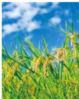
見直される朝倉産米の重要性

A 福岡県のJA全農くれんが、福岡市の下水処理施設から高度処理し再生したリン酸と、JA筑前あさくらの堆肥センターを含む県内の堆肥を混合した、従来より安い有機質肥料を開発しており、コスト削減等が見込まれる。