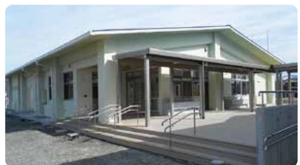
久喜宮地域防災拠点施設

A 松末小は今年度校舎の老朽度合の調査を行い、活用方法をコミュニティと協議中。杷木小は校舎跡地に公営住宅を建設済みで、運動場に防災広場を整備予定。久喜宮小は令和2年度に防災拠点施設が竣工し、今年度プールの跡地に防災広場を整備予定。志波小は3棟中2棟の校舎解体工事が終わり、残り1棟をリフォームして防災拠点施設とし、その後に防災広場も整備予定である。