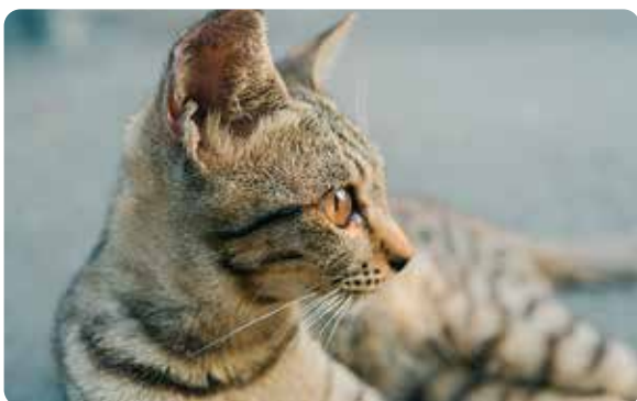
殺処分される猫が減るように

A 要望として受け止める。また、動物基金や獣医師会等の補助もあり、そちらの取組ができないか検討している。