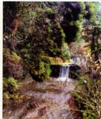
(写真左から) 朝倉市公式Instagramの取材で訪れた甘水の銘水と秋月 (令和5年12