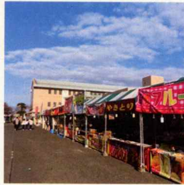
(写真左から) 朝倉農業高校跡地のイチョウ並木とあさくら祭り (令和5年11月撮影)

地域おこし協力隊として着任後は、移住定住を目的とした方へ最大2週間宿泊できるお試し移住の案内、空き家を売りたい、買いたい方へのサポート。令和6年2月には、博多で移住に関する相談会を行う予定で、その準備を進めています。そして、朝倉市公式Instagram (@asakurakouhou) のフォロワーを増やす為のPR活動を行っています。豊富な水源はもちろんの事、綺麗で美味しい水の町「朝倉市」。その水をピックアップして取材し毎週1回のペースで更新を行っています。令和6年1月現在、水汲み場をメインに取材していますが、今後は色々な角度から「水×○○」で取材・更新をできたらと考えています。何かいいネタあったら教えてください(笑)。