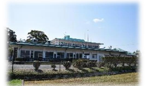
地域医療の維持（朝倉診療所）