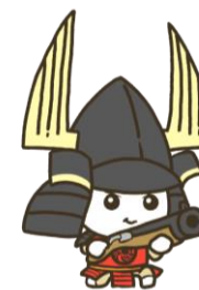
イメージキャラクター@「ながおき君」