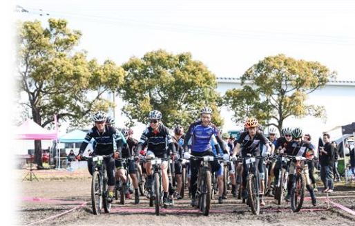
サイクルタウンプロジェクト