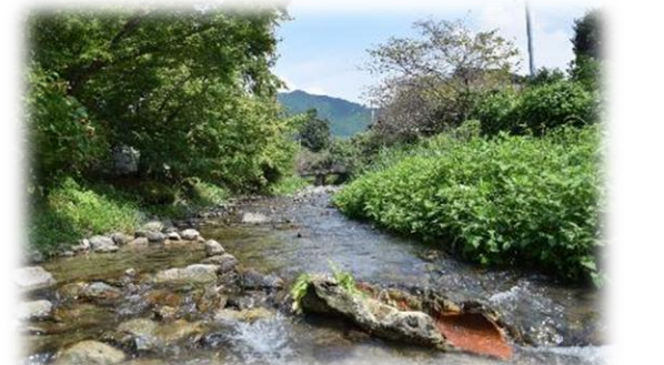
朝倉の豊かな自然