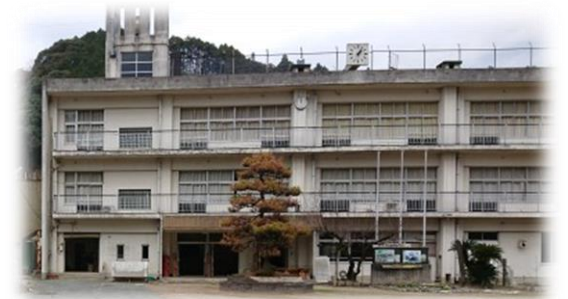
整備予定の旧松末小学校