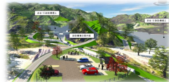
平成29年7月九州北部豪雨災害を語り継ぐ伝承広場 (イメージ)