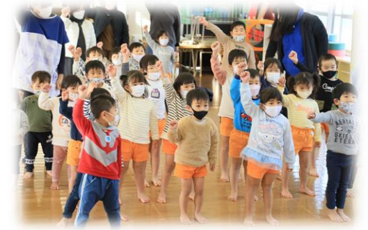
切れ目ない子育て支援