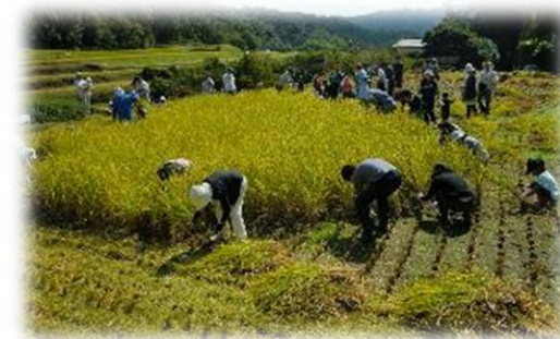
グリーンツーリズム