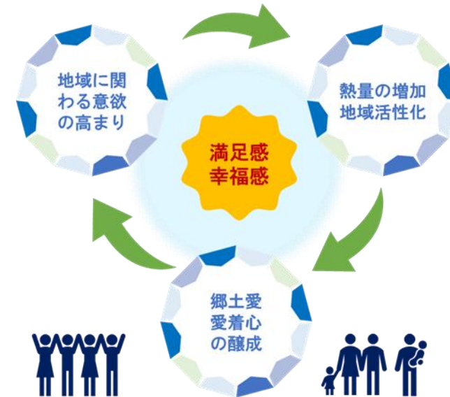
シティプロモーションの効果(イメージ)