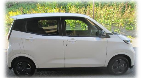
公用車のEV化で環境負荷を軽減