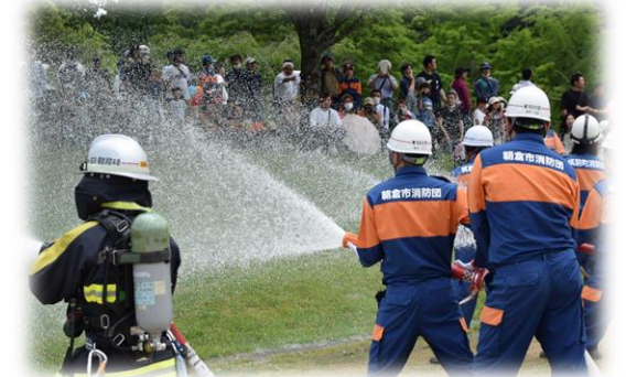
デジタルツールで消防団活動の負担を軽減