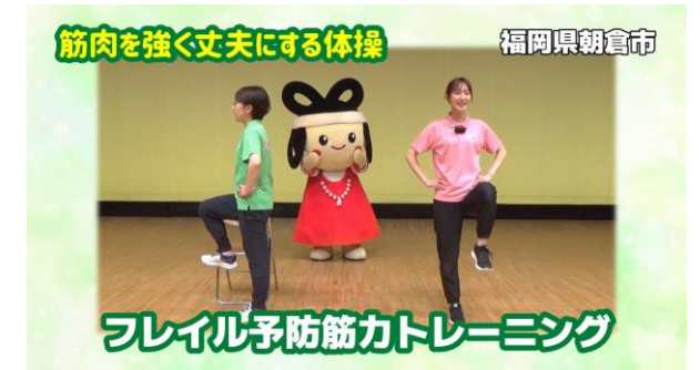
健康増進・予防医療の推進