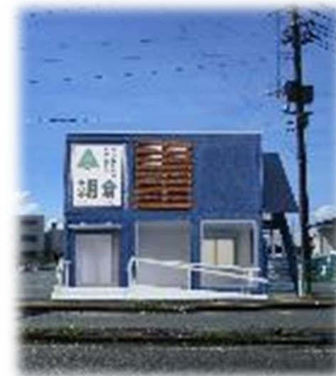
コンネアサクラ(イメージ)