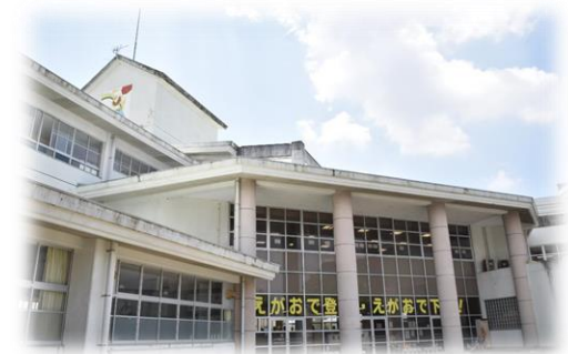
増築・改修予定の立石小学校