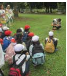
▲古代体験(火起こし)

【回答】 小中学校の体験学習は、車椅子な どの福祉体験や、平塚川添遺跡公園 での古代体験などを実施していま す。今後も児童生徒の豊かな心を育 成するため、各種体験活動の充実に 努めていきます。 あさくら献立は毎月1回実施して いますが、それ以外の日も出来るだ け多くの地元食材を使用して給食を 実施しています。