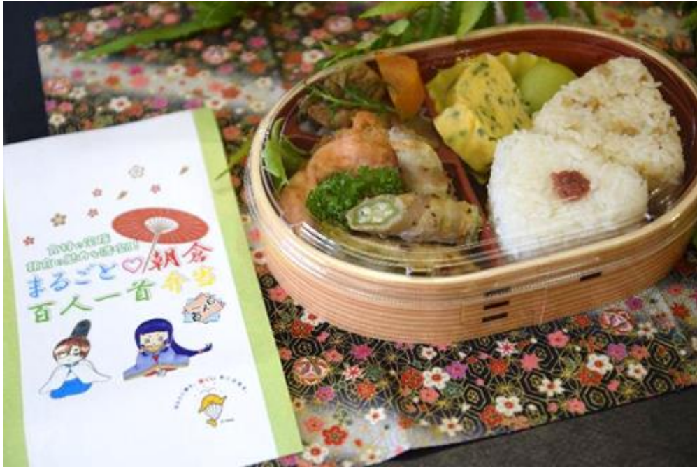
「まるごと朝倉 百人一首弁当」

【事業】 百人一首弁当を朝倉光陽高校の生徒と三連水車の里あさくらで協働開発し、三連水車の里あさくらで限定販売（8月下旬～10月下旬）（R3年度 ふるさと課）