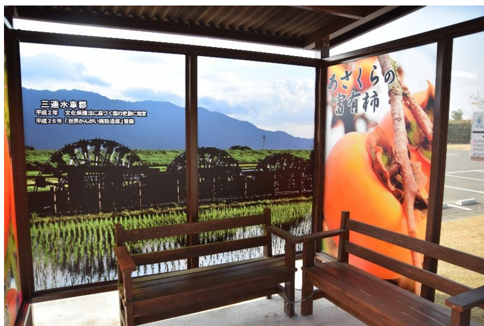
※H30年度に新設された三連水車の里のバス停待合所