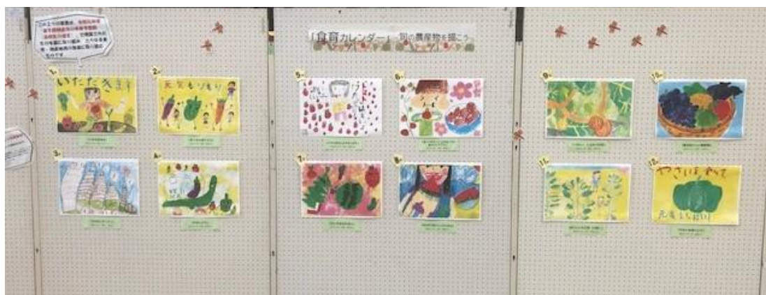
本庁1階ロビーと朝倉地域学習センターにおける「旬の農産物絵画」結果発表の様子

※カレンダーには、「旬の農産物絵画」の入賞作品やおにぎりレシピコンテストの入賞作品、農産物の豆知識等を掲載。「食育カレンダー」として市内の小、中学校の全生徒や幼稚園や保育園、高校、直売所等に配布。