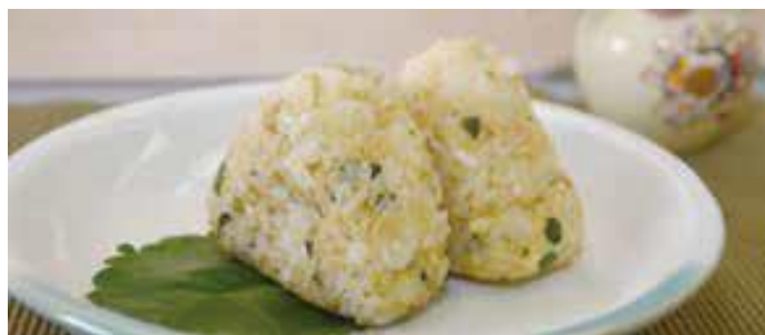
「カルシウムたっぷりおにぎり」

※令和3年9月6日、市立保育所の給食（おやつ）で、おにぎりレシピコンテスト小中学生部門・最優秀賞「カルシウムたっぷりおにぎり」が提供された。