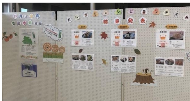
本庁1Fロビーと朝倉地域生涯学習における結果発表の様子

※令和3年9月6日、市立保育所の給食（おやつ）で、おにぎりレシピコンテスト小中学生部門・最優秀賞「カルシウムたっぷりおにぎり」が提供された。