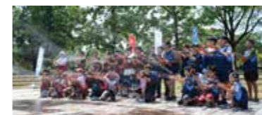
▲朝倉光陽高校による提言事業化の実施報告も行います。